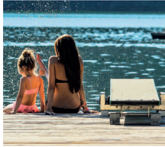
Die Region Kufstein – Glück im Einklang mit der Natur.