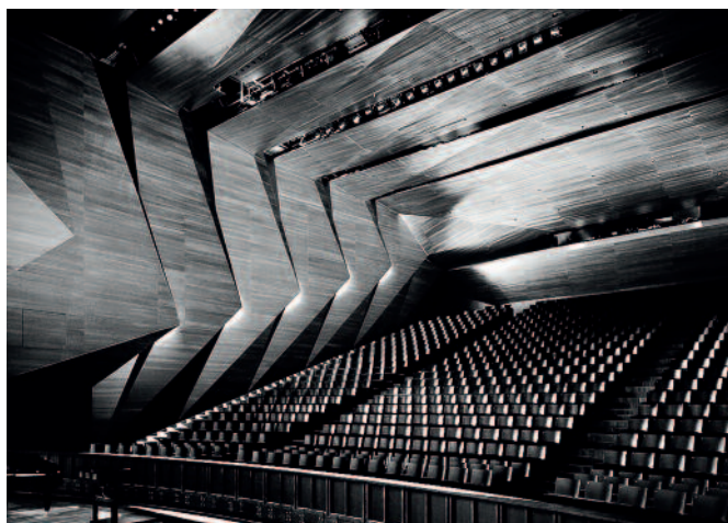
Den architektonisch stilvollen Rahmen für die musikalische Hochkultur in Erl bildet seit 2012 das einzigartige Festspielhaus.