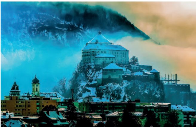
Kufstein ist dort, wo dem individuellen Glücksempfinden ein Festival gewidmet wird.